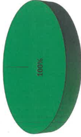
Grafica de Resultados