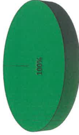
Gráfica de Resultados