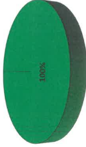
Grafica de Resultados