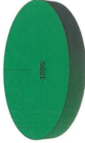
Grafica de Resultados