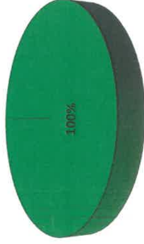
Grafica de Resultados