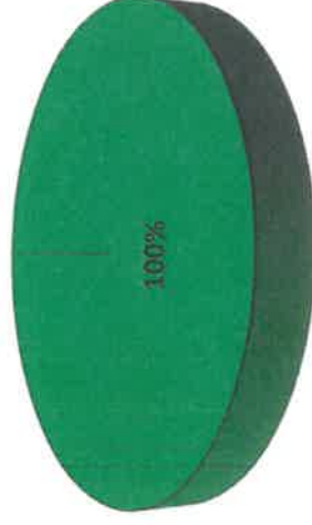
Grafica de Resultados