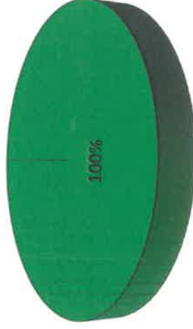
Gráfica de Resultados