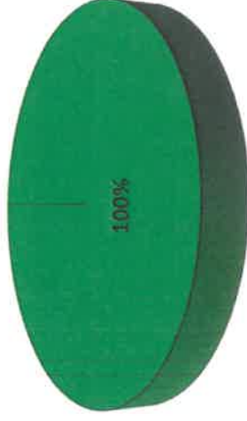
Gráfica de Resultados