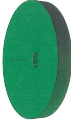
Gráfica de Resultados