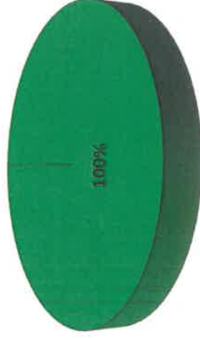
Grafica de Resultados