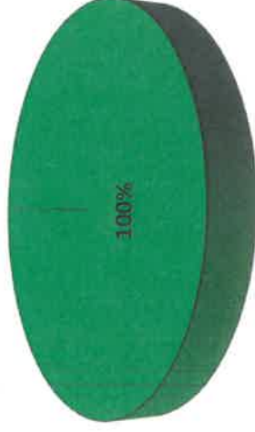
Grafica de Resultados