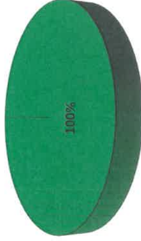
Gráfica de Resultados