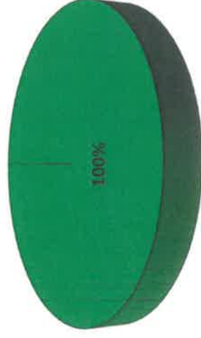
Grafica de Resultados