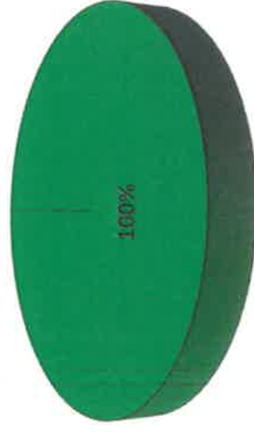
Grafica de Resultados