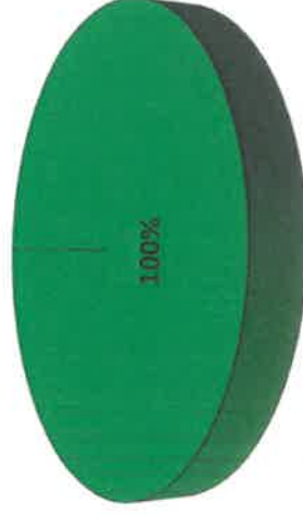
Gráfica de Resultados