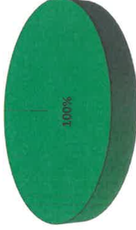
Grafica de Resultados