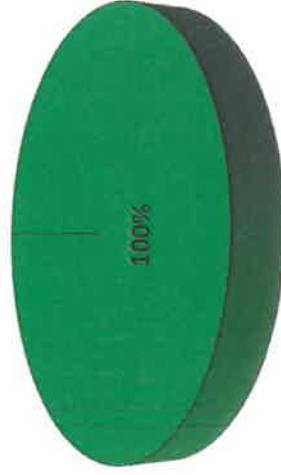
Grafica de Resultados