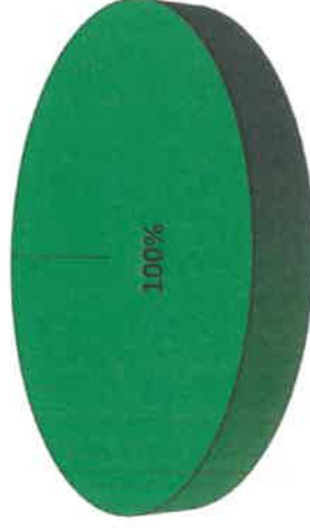
Gráfica de Resultados