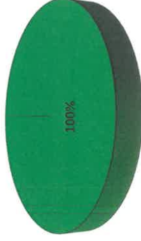
Gráfica de Resultados