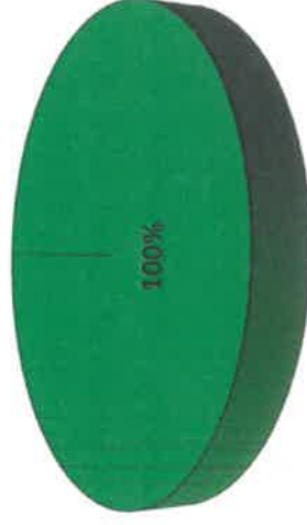
Gráfica de Resultados