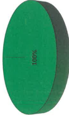
Grafica de Resultados