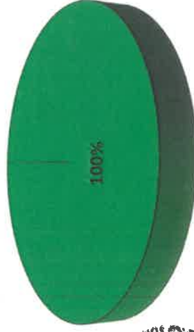
Grafica de Resultados