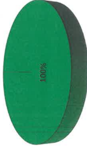
Gráfica de Resultados